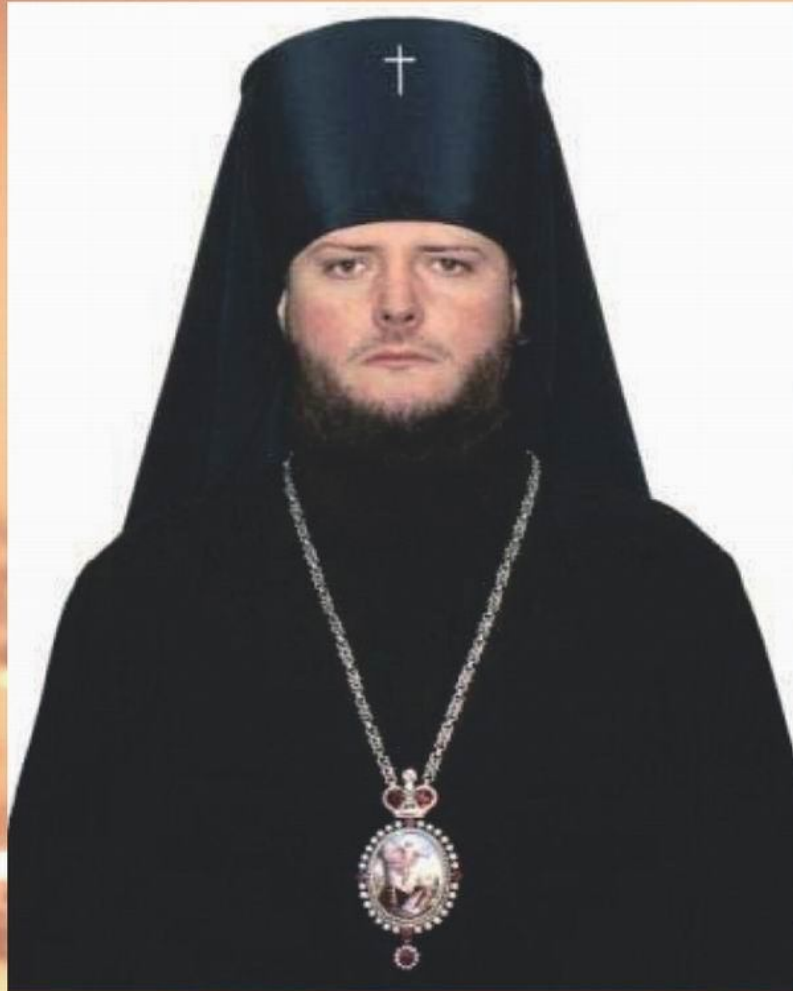
Архієпископ Алексій (в миру Сергій Олександрович Гроха) — єпископ Української православної церкви Московського патріархату, архієпископ Балтський і Ананьївський