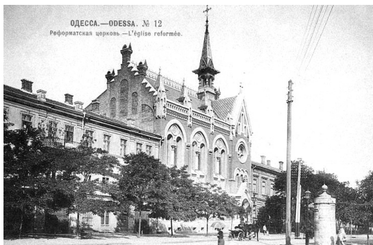
ОДЕССА.—ODESSA. № 12 Реформатская церковь.—L'église réformée.