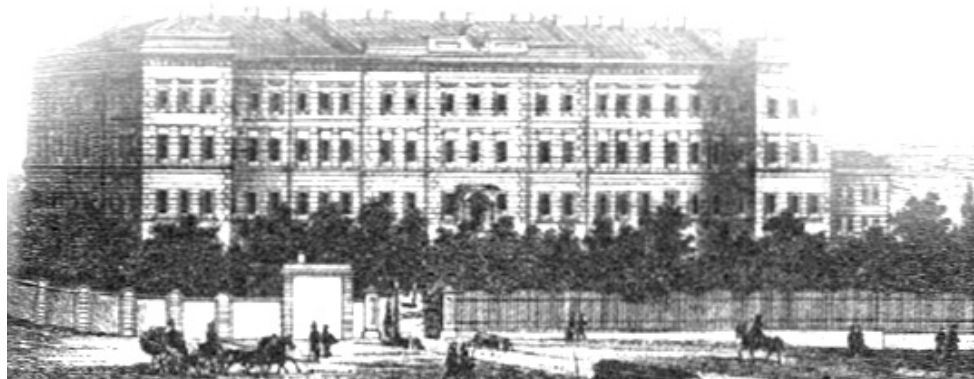
Институтъ благородн. Дѣвиць. Adliches Fräulein-Institut.

Херсонська губернія Херсонська єпархія місто Одеса