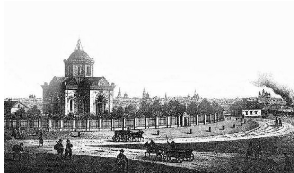
Церковь близ Тираспольск. Там. Kirche bei der Tirasp. Tamoschna.