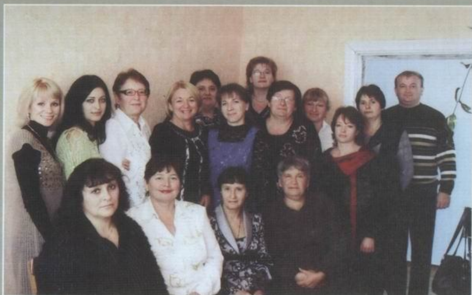
Педагогічний колектив вікторівської ЗОШ, 2008 р.