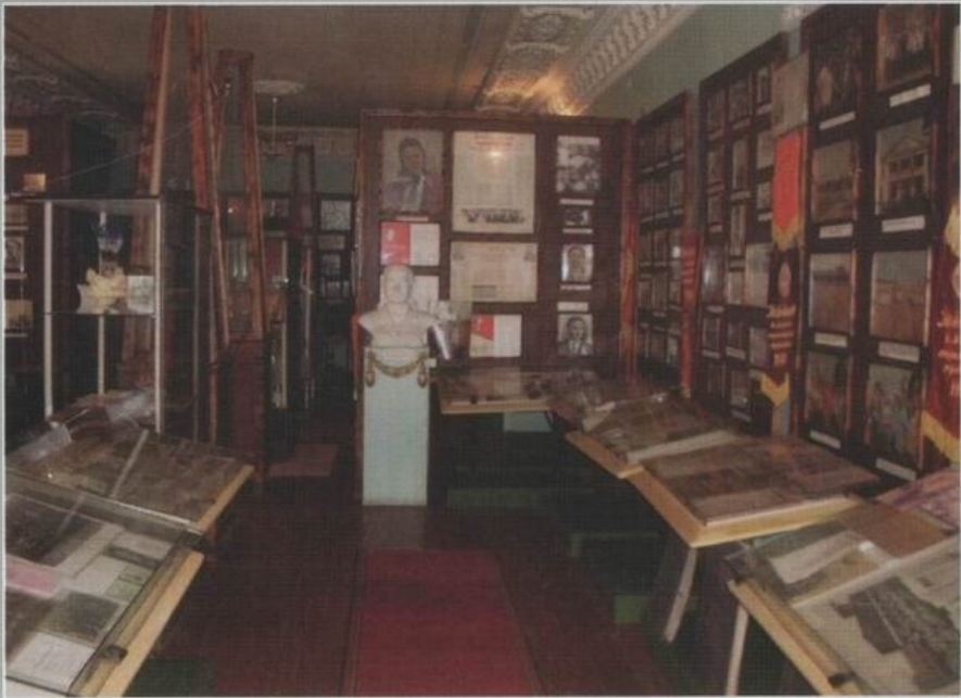
Стаківський історико-краєзнавчий музей.