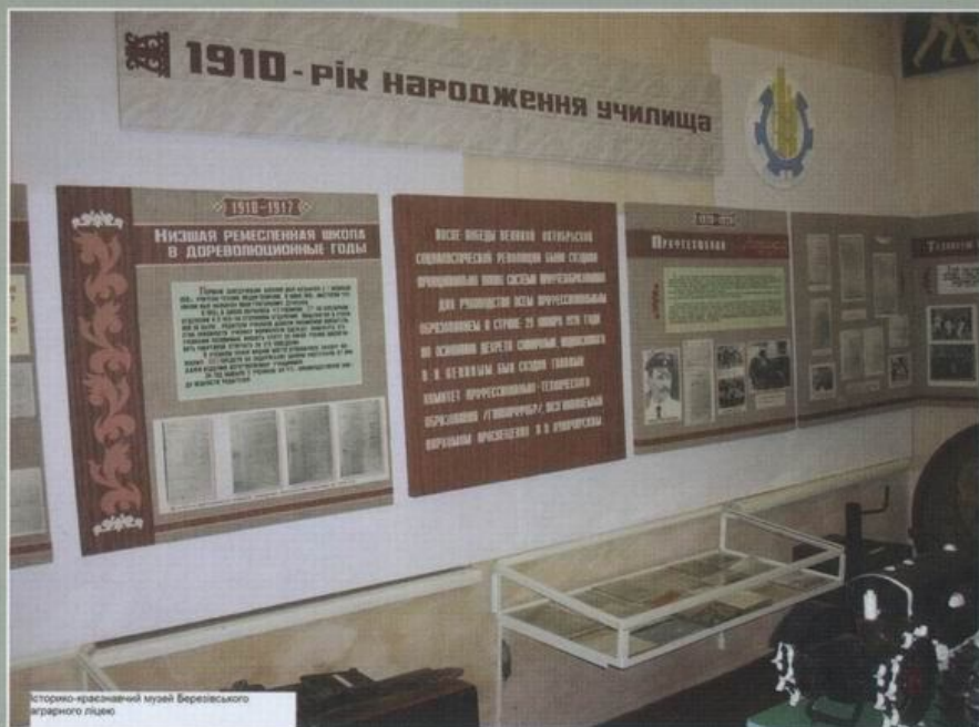
Історико-краєзнавчий музей Березівського аграрного ліцею