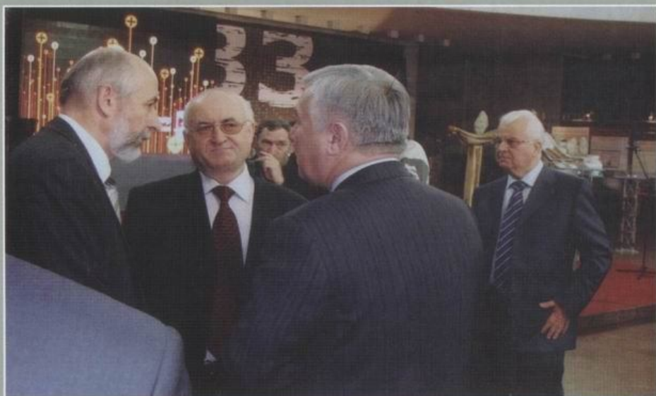
Новохатський Костянтин Євгенович - заступник голови Державного комітету архівів України, Ніточко Іван Іванович - директор Державного архіву Одеської області, Єхануров Юрій Іванович - міністр Збройних сил України, Кравчук Леонід Макарович - перший Президент України.