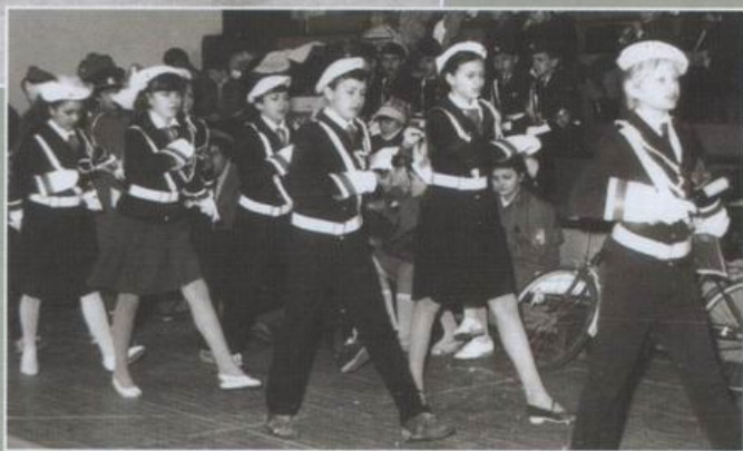
Огляд конкурсу строю і пісні юнармійських загонів. 1992 р.