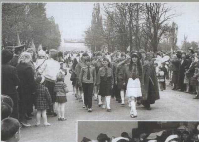
Раухівська ЗОШ. Конкурс строю і пісні юнармійських загонів. 1990 р.