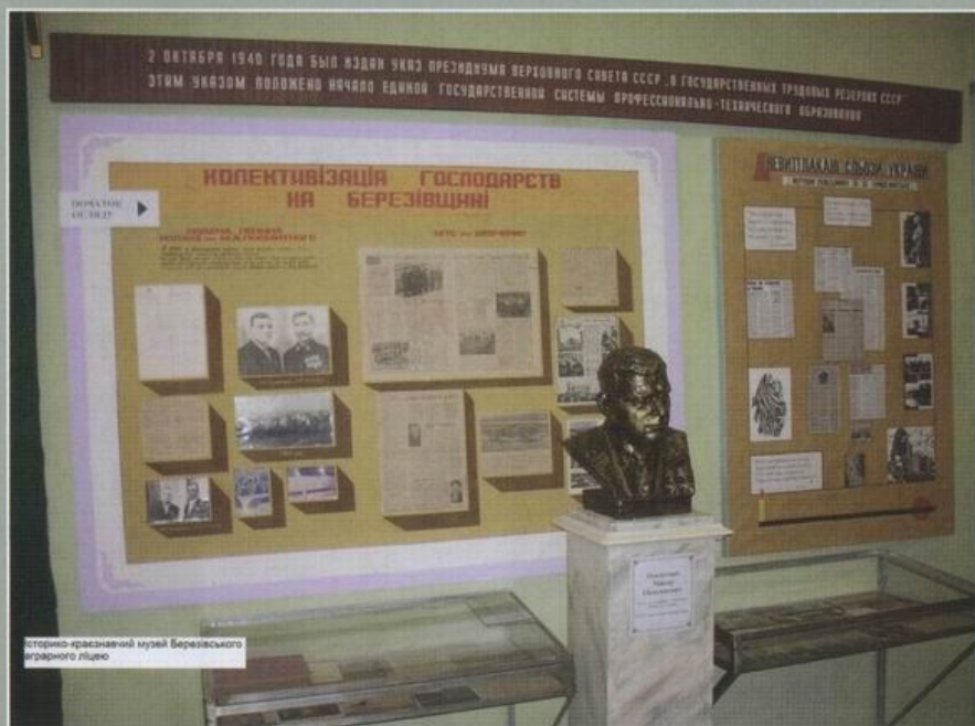
Історико-краєзнавчий музей Березівського аграрного ліцею