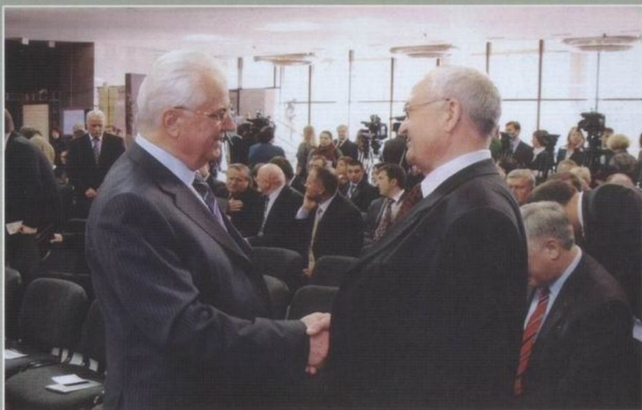
Перший Президент України Л.М. Кравчук з першим представником Президента в Березівському районі І.І. Ніточко, 2009 р.