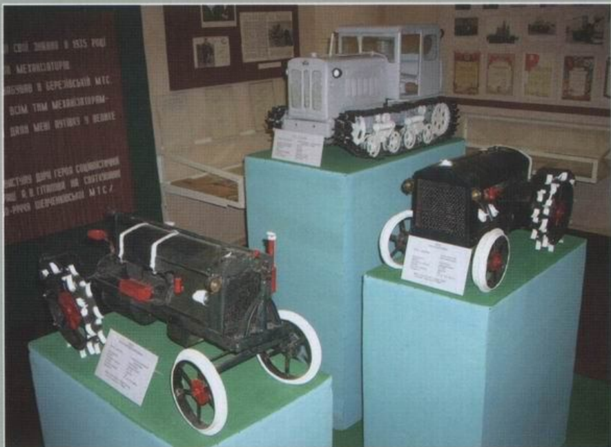
Історико-краєзнавчий музей Березівського аграрного ліцею.