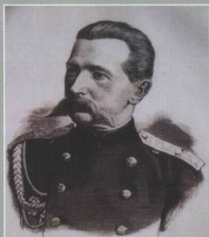
Заводівський генерал Раух Отто Єгорович (1834—1900 р.).

У другому ряду знизу в білій сорочці Поліщук Іван.