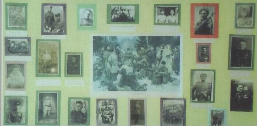
Историко-краєзнавчий музей Заводівської ЗОШ.