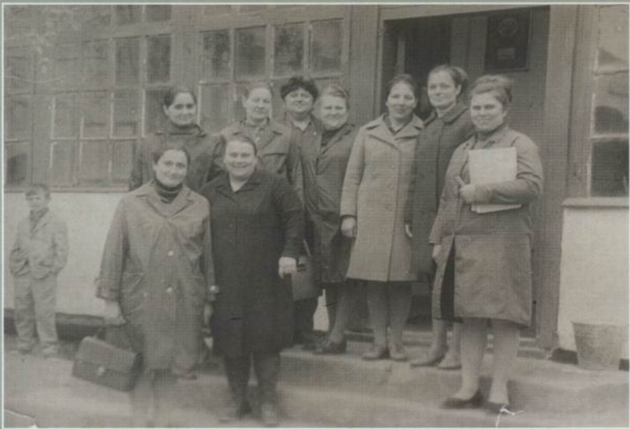
Виноградненська стара школа. Педагогічний колектив. 1970 р.