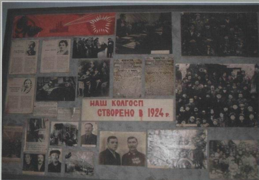
Розквітівський історико-краєнавчий музей.