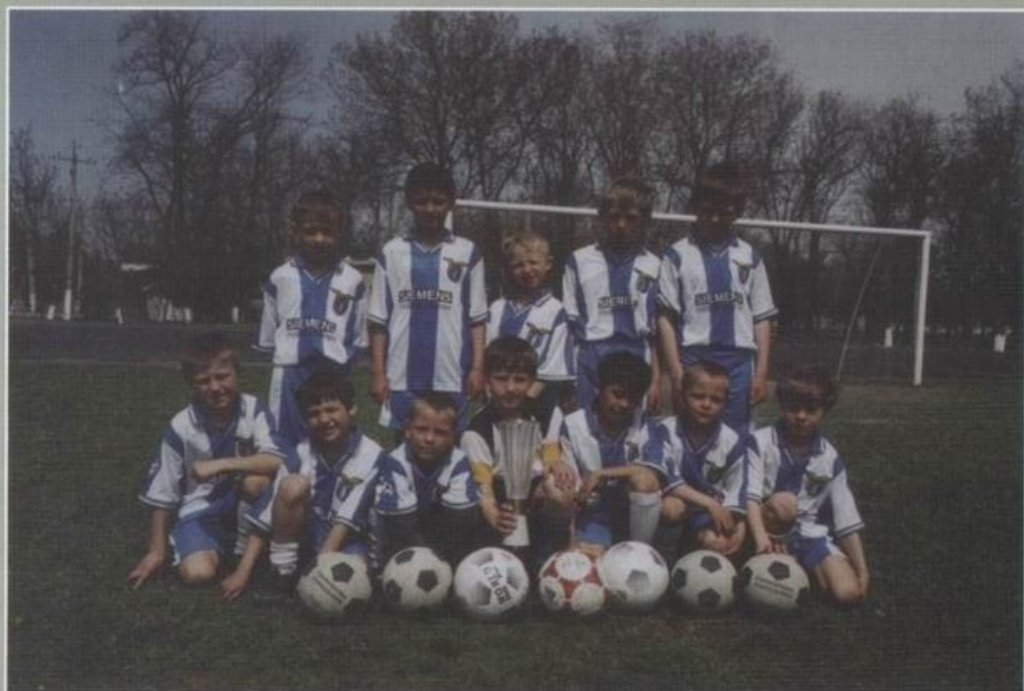
Команда Березівської ДЮСШ, яка зайняла перше місце в обласному турнірі юнаків 1993–1994 років народження.