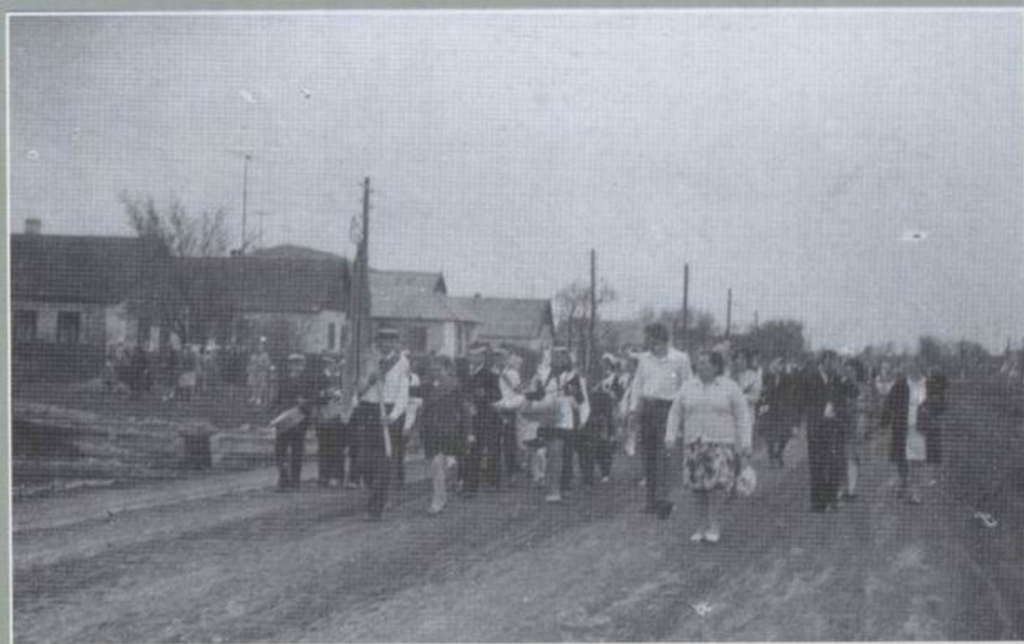
Анатолівська ЗОШ, 1976 р. Шлях на мітинг, присвячений Дню Перемоги.