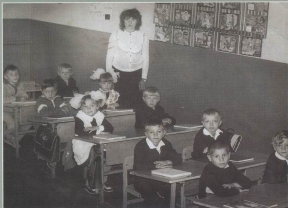
с. Семихатки, урок у першому класі, 1989 р.