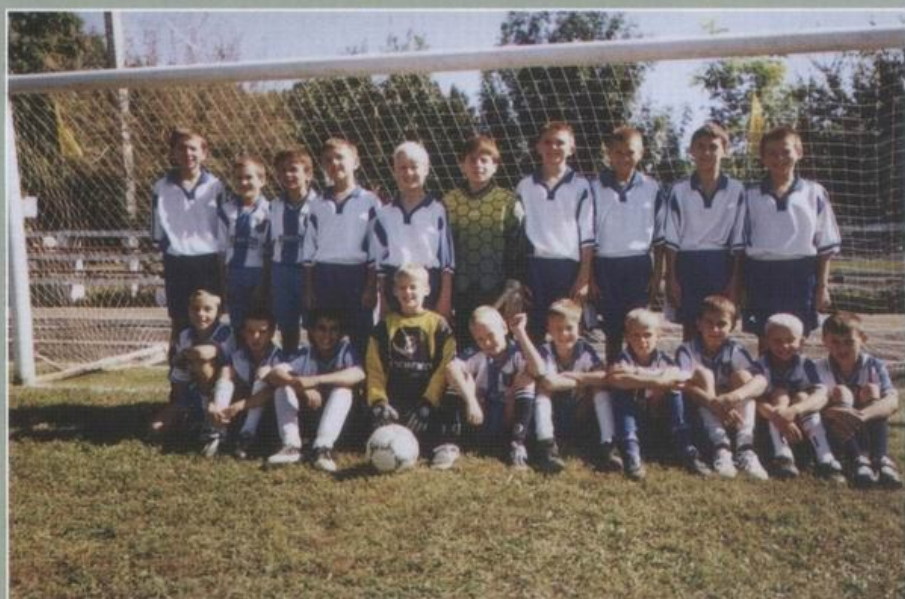
Команда-переможець відкритої першості Березівської ДЮСШ серед юнаків 1991–1992, 1993–1994 років навчання.