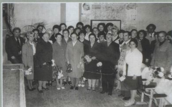
Березівська СШ №3. День учителя. 1980–1981 рр.