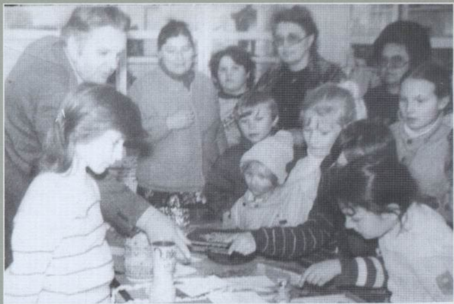
Музей Березівської ЗОШ №3.